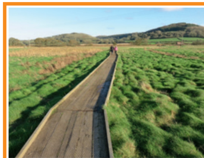
Alee construită din scânduri într-o zonă umedă în East Devon (Regatul Unit)

neproductive și să verifice în mod sistematic documentele justificative prezentate pentru a atesta conformitatea cu aceste criterii. De asemenea, statele membre ar trebui să asigure o separare adecvată a sarcinilor între organizațiile și persoanele implicate în transmiterea și selectarea cererilor de finanțare de proiecte.